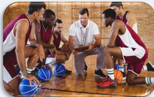
Figura: Así como el entrenador que lleva el equipo al alto rendimiento, el Scrum Master también saca lo mejor de sus compañeros.

Como es posible observar, convertirse en un Scrum Master no sólo se trata de obtener una certificación, sino de desarrollar habilidades prácticas y una comprensión profunda de los principios y valores de Scrum. La práctica continua y el aprendizaje son clave para crecer como Scrum Master efectivo.