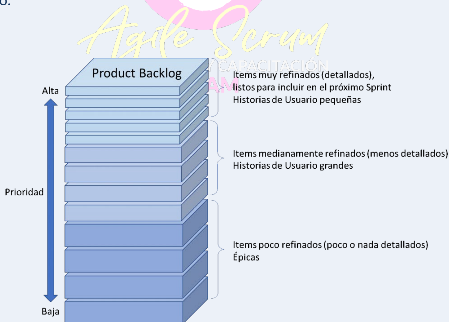
Figura: Product Backlog ordenado y priorizado

Cabe observar que, en cuanto a la definición y priorización del backlog del producto, el Scrum Product Owner trabaja en estrecha colaboración con los stakeholders y developers para identificar y definir los requisitos del producto. El Product Owner es responsable de mantener y priorizar el backlog del producto, que es la lista de todas las características, funcionalidades y mejoras planificadas para el producto. Esta priorización se basa en el valor de cada elemento del backlog aporta al cliente y al negocio.